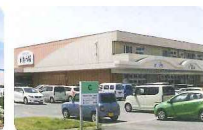
沼津卸団地 食遊市場