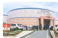
サントムーン柿田川

年間1,200万人が来場している大型ショッピングセンター「サントムーン柿田川」や各種さまざまな店舗が充実しています。町民意向調査においても買い物の利便性が高く評価されており、社員の生活環境の満足度向上にもつながります。