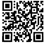
▲国税庁税務相談 チャットボット