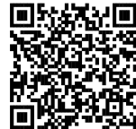
▲必要書類は こちら

住宅ローンを利用してマイホームを新築・購入等した方を対象として、事前に申告相談を受け付けます。必要書類が揃っていれば、その場で申告書の作成、提出ができます。