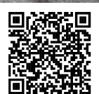
▲動画で見る確定申告