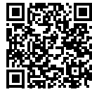
▲町 HP バナー募集中

※ホームページバナーも募集していただきます。詳しくはホームページをご覧ください。