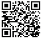
▲地方税お支払サイトはこちら