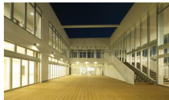
交流パティオ(中庭)