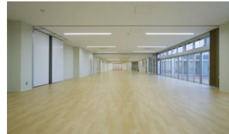
保健指導室＋くつろぎオアシス

今度の保健センターは、縦約30m、横約8m、面積で約240㎡(約160畳分)の大部屋があり、その大部屋で健(検)診等を実施します。部屋の中心にあるシャッターには、まぼろしの絵が…!!