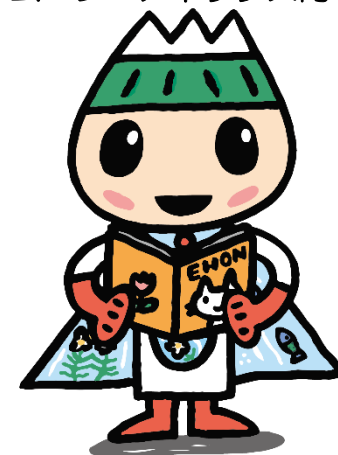
清水町ゆるキャラ「ゆうすいくん」

開館時間 午前の部 10時 ~ 12時 午後の部 13時 ~ 18時 休館日 火曜日・年末年始(12/29~1/3)